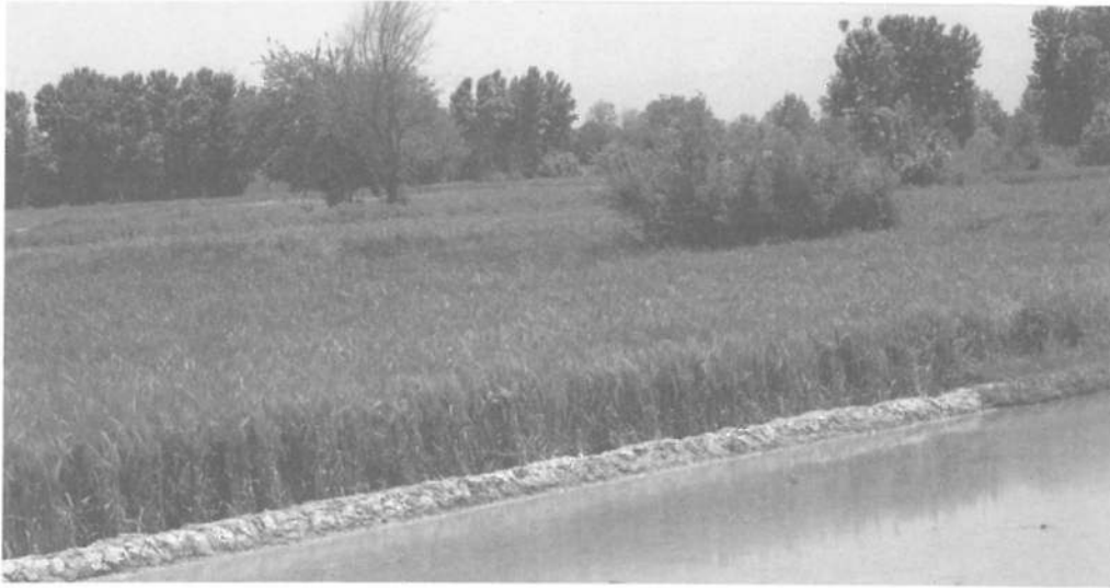
جدول ۴- محصولات مهم صادراتی استان اصفهان و مقایسه‌ی آن با کشور، منطقه‌ی خاورمیانه و جهان در سال ۱۳۸۲ (به هزار دلار)